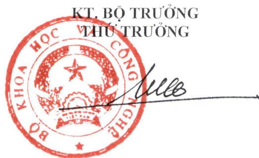
Phạm Công Tạc