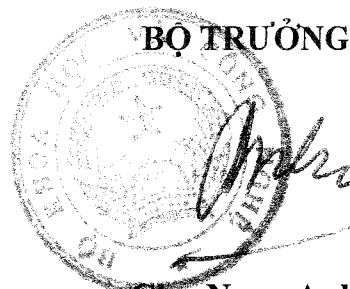
Chu Ngọc Anh